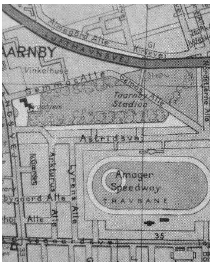
Kort over Taarnby med speedway banen inde i travbanen

Ved banens åbning den 4. september 1952 kunne følgende læses i løbets program (forkortet):